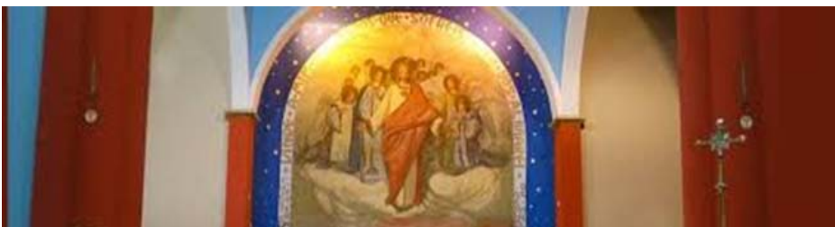
Imagem do Sagrado Coração de Jesus – Matriz da Paróquia Sagrado Coração de Jesus – Vila dos Lavradores – Botucatu, SP

O objeto dessa devoção é o Coração do Verbo Encarnado , tanto considerado no seu aspecto corporal quanto no símbolo de seu amor por Deus e pelos homens.